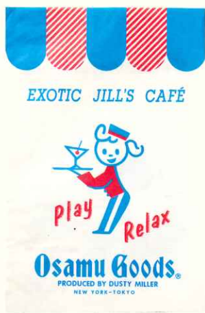
ショップバッグvol.47(OSAMU GOODS®) 1989年 ©Osamu Harada / Koji Honpo