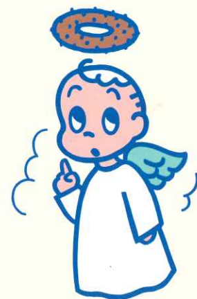
ミスタードーナツ キャンペーン用キャラクター 1986年