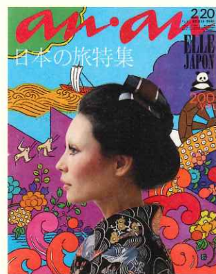
「an·an」第47号 1972年 平凡出版 アートディレクション: 堀内誠一 表紙イラストレーション: 原田治