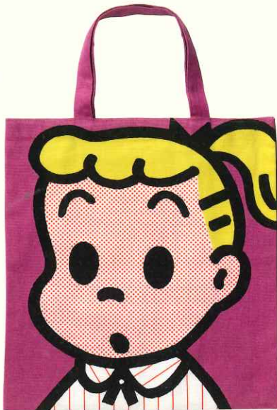
スクールバッグ(OSAMU GOODS®) 1992年 ©Osamu Harada / Koji Honpo