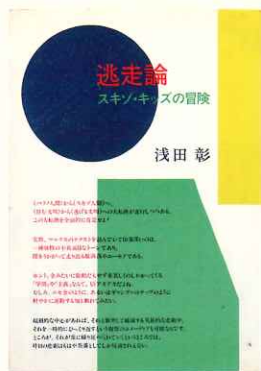
浅田彰「逃走論」 1984年 筑摩書房 装幀: 原田治