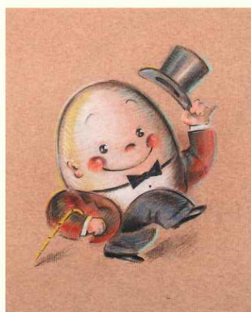
HUMPTY DUMPTY (OSAMU GOODS用原画) 1970年代後半-1980年前半