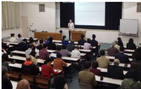
大学の先生による講話

釧路学教養講座(5月~12月土曜・13回) 受付: 4月26日までハガキにて(18名)