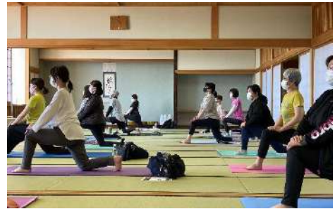
ボディメイクヨガ

わくわくセカンドライフ(5月~12月木曜・18回) 受付: 4月5日~(20名募集)