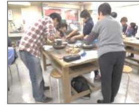
地下1階 (工芸スタジオA・B・C。木工・陶芸・染色を行っています)

釧路市生涯学習センター「まなぼっと幣舞」は、地下1階、地上10階建て、形は灯台を、色は湿原の秋をイメージした建物です。10階展望室は、海拔66メートルの位置にあり360度のパノラマを見ることができます。各階には市民のニーズを取り入れた部屋や施設設備があり、多くの市民が訪れ、それぞれの生涯学習に励んでいます。 (愛称「まなぼっと」は「何か学んでみようと思いついたらいつでもだれでも気軽に立ち寄れる場所<スポット>という意味です」)