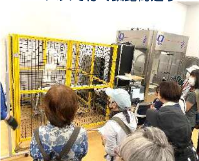
バスで行く釧路街巡り

子どもチャレンジ(6月～1月土曜・4講 座) 受付：各講座ごと(20～25名募集)