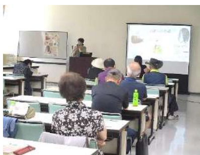
生き物会議～解説と観覧

釧路学教養講座(5月～12月土曜・13回) 受付：4月19日までハガキにて(20名 募集)