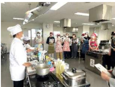
おもてなし料理教室

託児付き子育て応援講座(5月～12月 火・水曜・13講座(15回) 受付： 各講座ごと(16～24名募集)