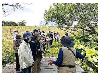
霧多布散策による植物観察

釧路学教養講座(5月～12月土曜・13回) 受付：4月19日までハガキにて(20名 募集)