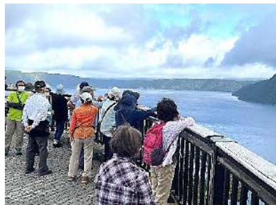
阿寒摩周国立公園

わくわくセカンドライフ(5月～12月木曜 ・18回) 受付：4月2日～(20名募集)