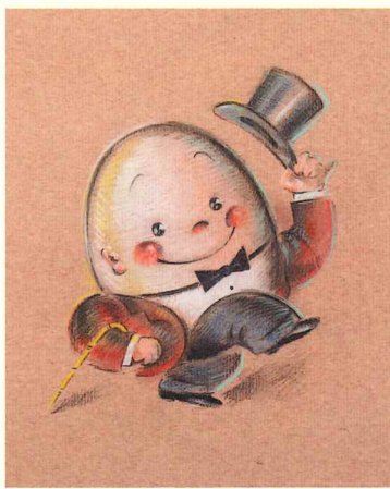
HUMPTY DUMPTY (OSAMU GOODS用原画) 1970年代後半-1980年前半