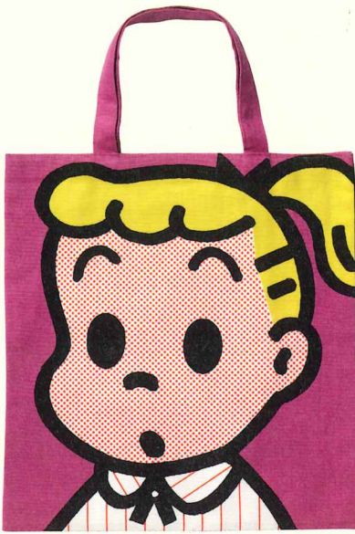
スクールバッグ (OSAMU GOODS*) 1992年 ©Osamu Harada / Koji Honpo