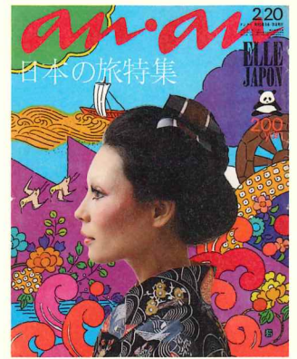
[an·an]第47号 1972年 平凡出版 アートディレクション：堀内誠一 表紙イラストレーション：原田治