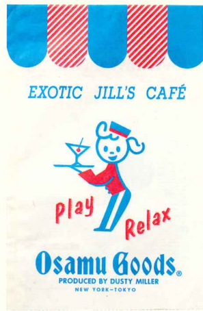
ショップバッグvol.47 (OSAMU GOODS*) 1989年 ©Osamu Harada / Koji Honpo