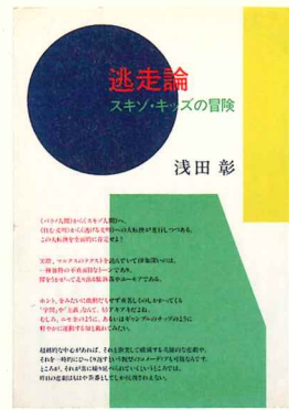
浅田彰「逃走論」 1984年 筑摩書房 装幀：原田治