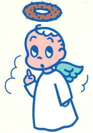
ミスタードーナツ キャンペーン用キャラクター 1986年