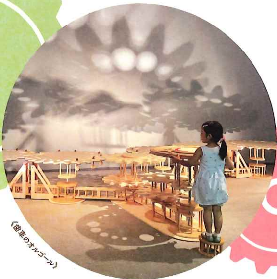
《歯車のオルゴール》