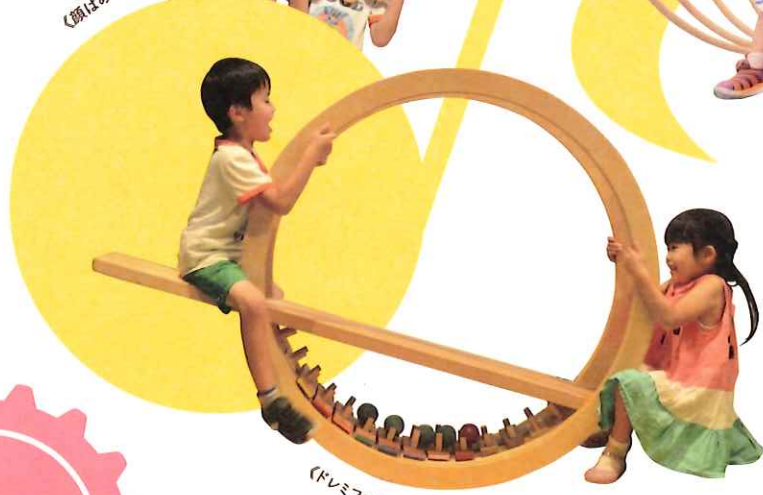
《ドレミファソーソー》